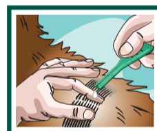
2. Afaste o pêlo e aplique o produto diretamente na pele.